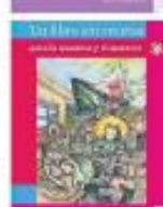
Los libros de texto son el resultado de una revisión en silencio, afirma reportero.

“Ignorar las matemáticas es un crimen de lesa humanidad”, afirma la autora de los libros Escolares y Lenguajes .