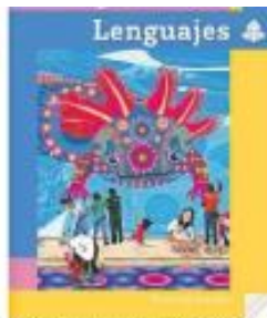
Los libros de texto gratuitos y los planes de estudio fueron revisados por el gobierno de AMLO para evitar a su vez la NEEM, pero sin éxito y con cambios complejos, afirma reportero.